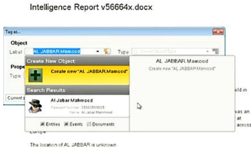
图 2. 建立文本中本体与本体间的关系